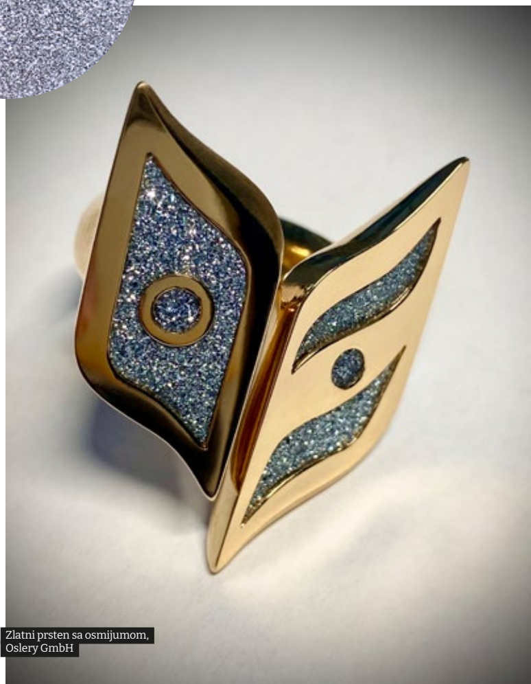
Zlatni prsten sa osmijumom, Oslery GmbH