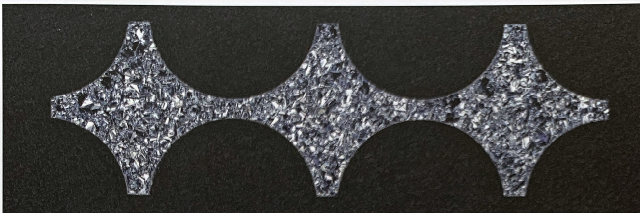
Starrings entsprechen in der Welt des Goldes der brechbaren Splitbar

den. Auf der anderen Seite gibt es keinerlei Möglichkeit, Osmium zu fälschen. Seine Kristallstruktur ist als nanometer-genauer Scan in der Osmium-Welt-Datenbank abgelegt. Sie ist bereits auf einem Quadratmillimeter kristalliner Fläche um mehr als das 10.000-fache sicherer als ein biologischer Fingerabdruck.